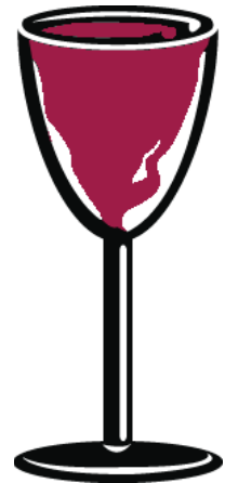
una copa de vino